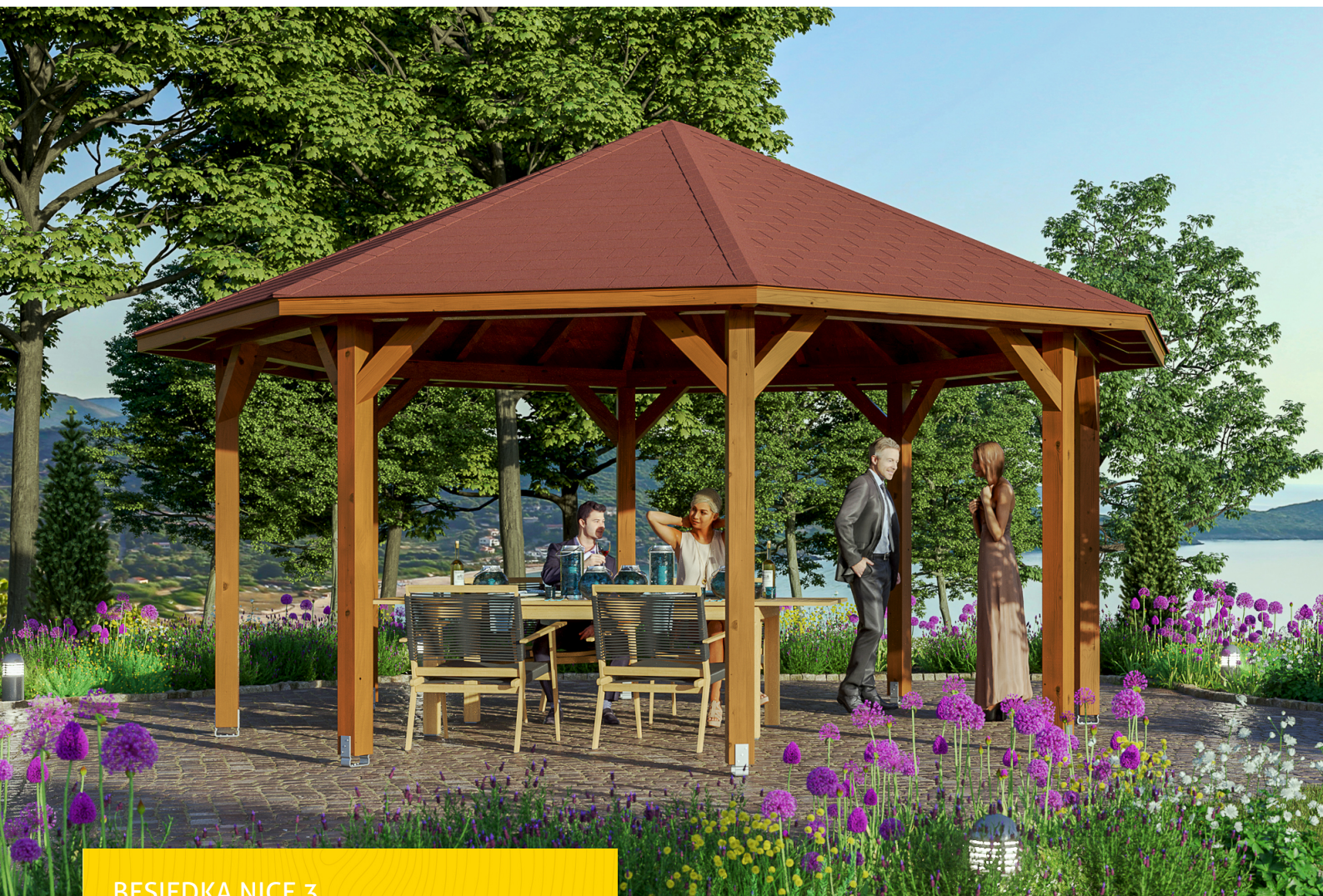
BESIEDKA NICE 3 3 - Ø 557 cm

Masívna konštrukcia z vysokokvalitného lepeného dreva (smrek BSH)