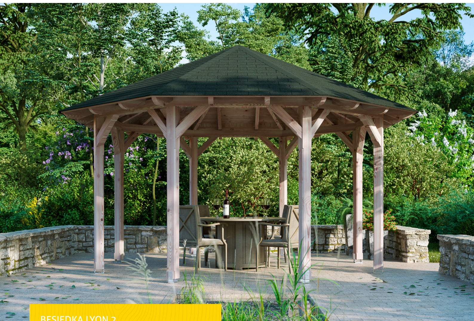
BESIEDKA LYON 2 2 - Ø 484 cm

Masívna konštrukcia z vysokokvalitnej douglasky