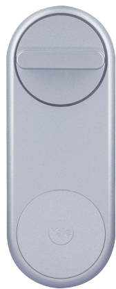
Inteligentný zámok Yale Linus® Smart Lock

Zdieľajte prístup do svojho domova s dôveryhodnými priateľmi a rodinou, aby boli doma vítaní rovnako srdečne ako vy. Vytvorte si vlastné scény, v ktorých sa svetlá Philips Hue rozsvietia alebo zhasnú podľa toho, kedy zámok Yale odomknete alebo uzamknete vy či vybraní hostia.