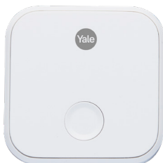
Yale Connect Wi-Fi Bridge